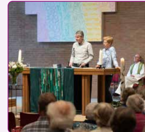
Zomervieringen met de NoorderLichtgemeente