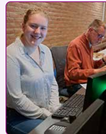
Jonge aanwas achter de techniektafel

Die creativiteit in muziek en kunst komt terug in vieringen, als wij ons verdiepen in de verhalen uit de Nieuwe Bijbel Vertaling. Voor kinderen is er twee keer per maand Kinderkerk. Op feestdagen wordt de viering extra luister bijgezet door een zanggroep of een instrumentaal ensemble. Ook helpen gemeenteleden vieringen voor te bereiden. Al onze vieringen zijn met beeld en geluid te volgen via YouTube en via Kerkomroep.