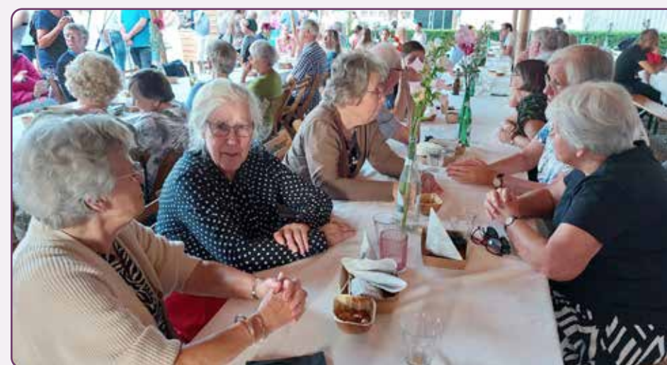
Het gemeentewerk start in september en duurt ongeveer tot en met de Paasdagen. We starten het seizoen feestelijk met verschillende activiteiten voor onze kinderen en jongeren. Een gezamenlijke BBQ op het kerkterrein markeert het begin van deze mooie periode.

Op zondagen komt onze gemeente om 10.00 en om 17.00 uur bijeen in een dienst van Woord en gebed. Dat zijn hoogtepunten van de week. Wij lezen dan uit de Herziene Statenvertaling en zingen Gods lof met psalmen (1773) en liederen (Weerklank).