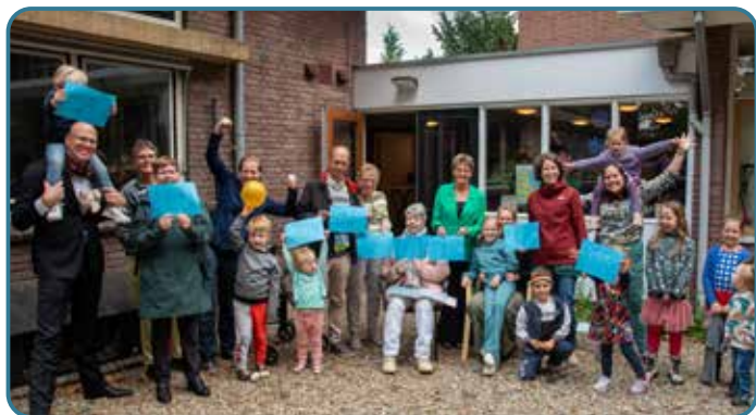
Samen Sterk in de NoorderLichtkerk

Op 1 september beleefden we met elkaar de Startzondag met het thema Samen . Na de koffie konden we kiezen uit verschillende 'samen-groepen', bijvoorbeeld samen oplopen, samen wandelen, samen zingen, samen bidden of samen buiten. De dag werd afgesloten met een gezamenlijke maaltijd.