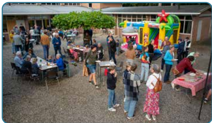
Huis-tuin-en-kerkdag met gemeenteleden en buurtgenoten

Er waren mooie ontmoetingen op de huis-tuin-en-kerkdag. Onder het genot van een herfstzonnnetje en stukken pizza konden we in gesprek met elkaar en met de burens uit de wijk. En voor de kinderen was er een mooi springkasteel!