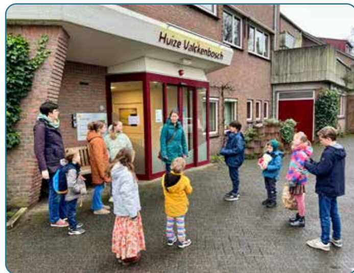
Kinderen van de kinderdienst bezoeken Huize Valkenbosch

In het kader van 'omzien naar elkaar' zijn de kinderen van de kinderdienst samen met de leiding naar Huize Valkenbosch geweest. Daar werd met de bewoners mens-erger-je-niet en stapeldieren gespeeld. Het was een ochtend vol glimlachen, verwondering en plezier.