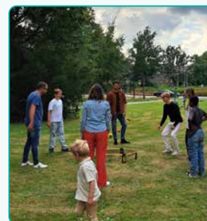
opening winterwerk september 2024