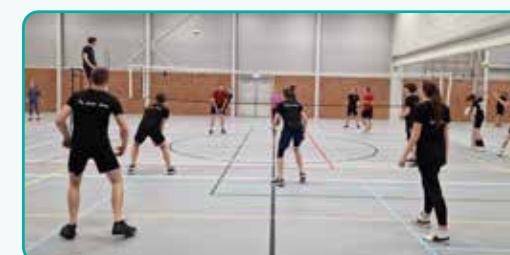
volleybaltoernooi Sola Gratia