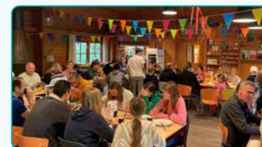
gemeenteweekend in Amerongen

Onze wijkgemeente organiseert activiteiten voor jong en oud, waaronder een gemeenteweekend. Omdat we veel jongeren hebben, zijn er per leeftijdsgroep voor hen specifieke activiteiten. Ouderen worden bezocht door leden van de Hervormde Vrouwendiensten, een seniorenpredikant en twee ouderlingen. En er zijn regelmatig ontmoetingen tussen oudere en jongere gemeentelieden, waarin zij hun geloofsbeleving met elkaar kunnen delen. We stimuleren alle gemeentelieden, ook jongeren, om zich actief in te zetten in onze gemeente en betrekken hen bij bijvoorbeeld acties en kerkdiensten. Vele handen maken immers licht werk!