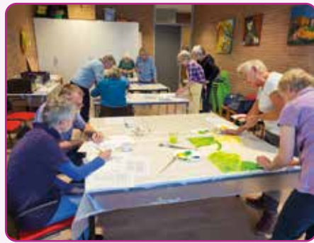
Schilderen voor advent en kerst 2023

Om ons heen zien we een samenleving waar de tegenstellingen tussen mensen soms hoog oplopen. Fijn dat de kerk in Zeist-West dan een gastvrije ruimte mag zijn, waar we op adem komen en met elkaar in gesprek gaan over de kern van ons leven. Waar we samen zoeken naar bezieling en inspiratie vinden.