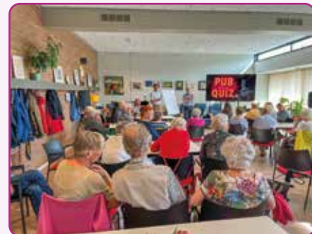
Pub quiz op de startzondag

Het komende jaar willen we het liturgisch centrum vernieuwen en de opbrengsten van Kerkbalans gebruiken voor jeugdwerk, pastoraat, onze kerkapp en voor verduurzaming van het kerkgebouw. Alleen samen kunnen we dit waarmaken! Ook in de toekomst kunnen we dan een gastvrije plek blijven waar mensen zich veilig en door God geliefd weten.