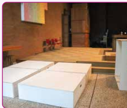
Onderdelen voor nieuw podium

Geef vandaag voor de kerk van morgen: een kerk die inspirerend, gastvrij en verbindend is. Jouw steun is daarbij van onschatbare waarde.